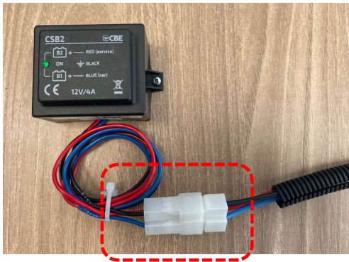
CSB2 p/n 205025