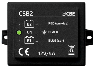
CSB2 p/n 205025