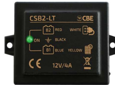
CSB2-LT p/n 205026